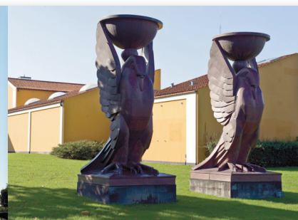
J.F. Willumsens Museum

Frederikssundegnen før og Frederikssund Kommune nu