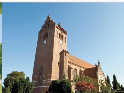
Sct. Michaels Kirke, Slangerup